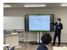
セミナー開催のイメージです。お気軽にお問い合わせください。